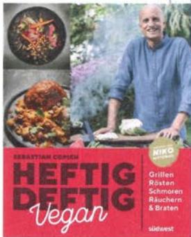
Heftig Deftig Vegan von Sebastian Copien (20 Euro, südwest Verlag)