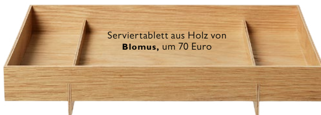
Serviertablett aus Holz von Blomus , um 70 Euro