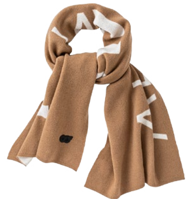
Logo-Schal aus Merinowolle und Cashmere, von Alpha Tauri , um 200 Euro