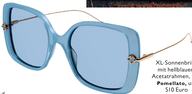
XL-Sonnenbrille mit hellblauem Acetatrahmen, von Pomellato , um 510 Euro