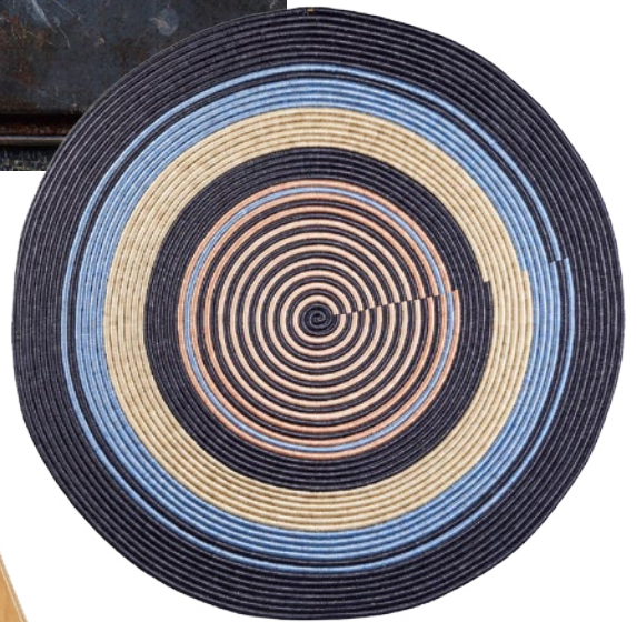
Handgewebte Wanddecoration aus Agaven- und Feigenblattfasern von Ames Living , um 2215 Euro