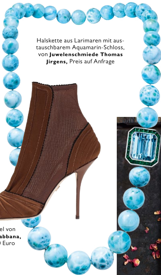
Halskette aus Larimaren mit austauschbarem Aquamarin-Schloss, von Juwelenschmiede Thomas Jürgens , Preis auf Anfrage