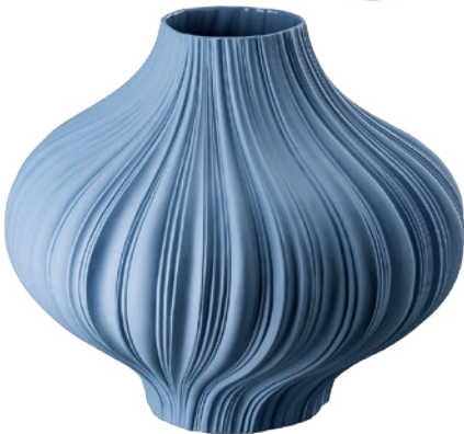
Porzellanvase in Plissee-Optik von Rosenthal , um 485 Euro