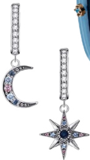
Ohringe aus Weißgold mit Diamanten, von Thomas Sabo , Preis auf Anfrage