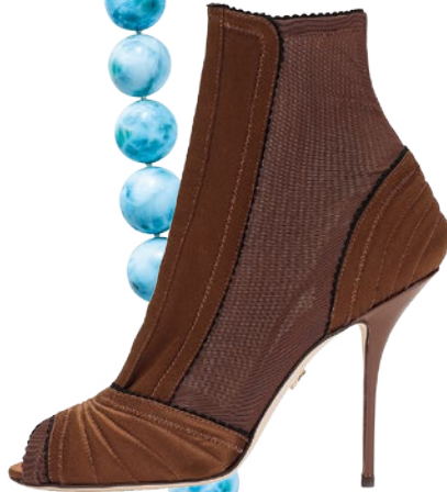
High Heel von Dolce & Gabbana , um 1200 Euro