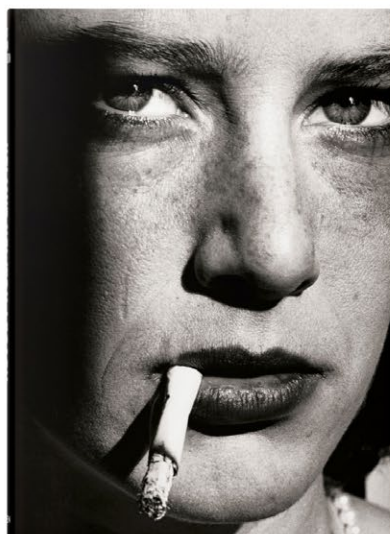
Helmut Newton. Legacy.