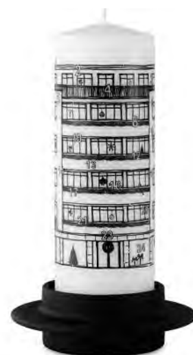
Für einen richtigen Adventskranz ist es bis zum 24. natürlich nie zu spät. Eine Alternative wäre einfach eine Kerze. (Normann Copenhagen)