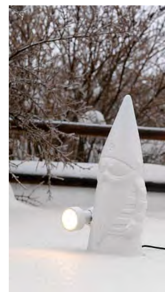
Unwahrscheinlich, dass bis Weihnachten ein Schneemann im Garten steht. Hier wäre einer, sogar mit Taschenlampe. (Karman)