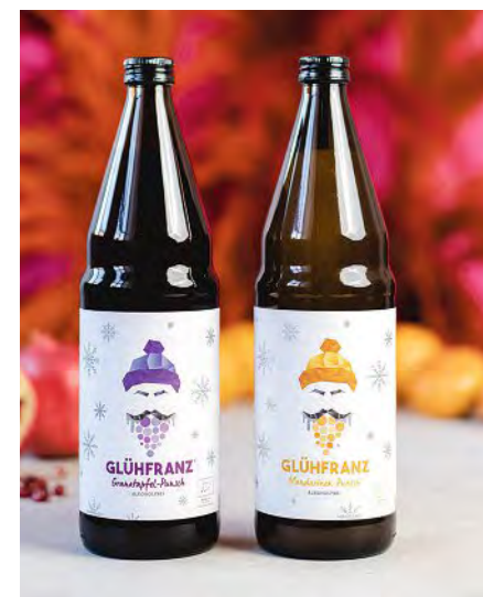
Glühwein hat im vergangenen Jahr einen schlechten Ruf bekommen. An den To-go-Ständen bildeten sich häufig nicht coronakonforme Trauben. Glühfranz könnte nun dabei helfen, ihn zu rehabilitieren. (Schorlefranz)

Keine Sorge, niemand muss selbst graben. Über den Online-Marktplatz „Shop a Tree“ kommt man an Waren der typischen Fußgängerzonen-Läden – und tut auf jeden Fall dem Gewissen einen Gefallen.