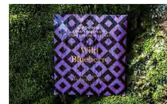
Eine kleine finnische Schokoladenmanufaktur zeigt, dass die Farbe Lila noch lange nicht einem großen Mitbewerber gehört. (Goodio)

Bedeutende Dinge, Menschen, Ideen, Orte und weitere Kuriositäten, zusammengestellt von Jennifer Wiebking