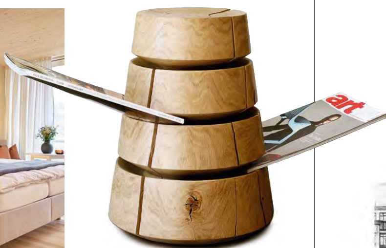
Mit diesem Möbelstück gründen die Produktdesigner hinter Siebensachen mal eben ein neues publizistisches Genre. Zum Coffeetable-Buch, das auf glatten Oberflächen ruhen soll, gibt es jetzt das Hocker-Magazin, das wie beiläufig im Holz steckt.