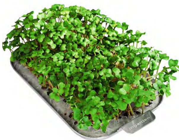
Aus diesem Kraut soll einmal Grünkohl werden. Mit den Systemen von ingarden braucht es dazu noch nicht einmal ein Hochbeet.

Kapseln sorgen leider für den auch in ökologischer Hinsicht bitteren Beigeschmack von Kaffee. Public bietet immerhin biologisch abbaubare Alternativen.