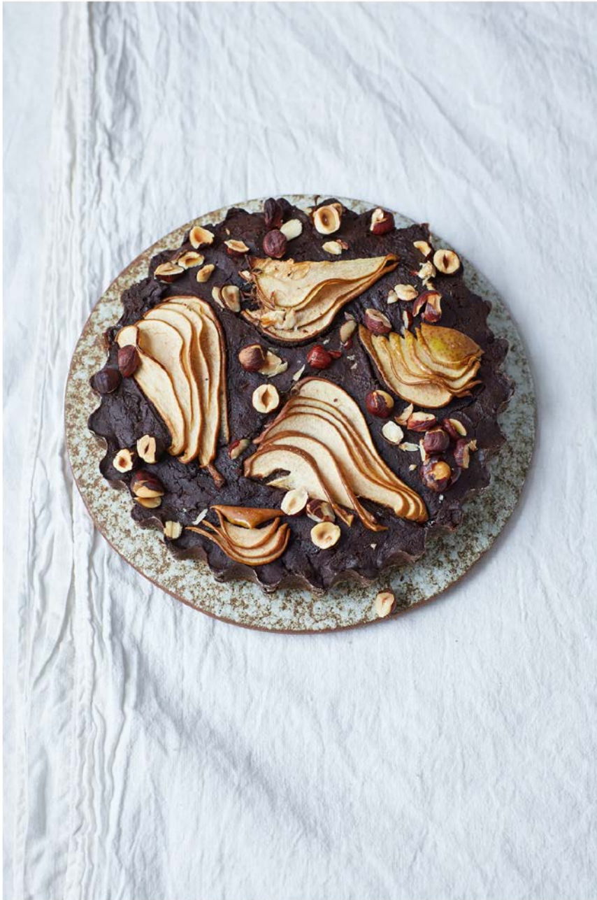
Noch ist Birnen-Saison! Wie wäre es also mit einem fluffigen Schokoladen-Birnen-Kuchen, getoppt mit Birnenscheiben und knusprigen Haselnüssen? Maria Grossmann